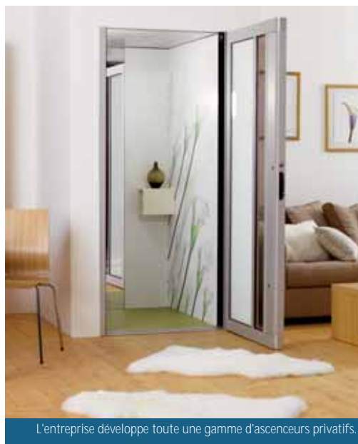
L'entreprise développe toute une gamme d'ascenseurs privés.