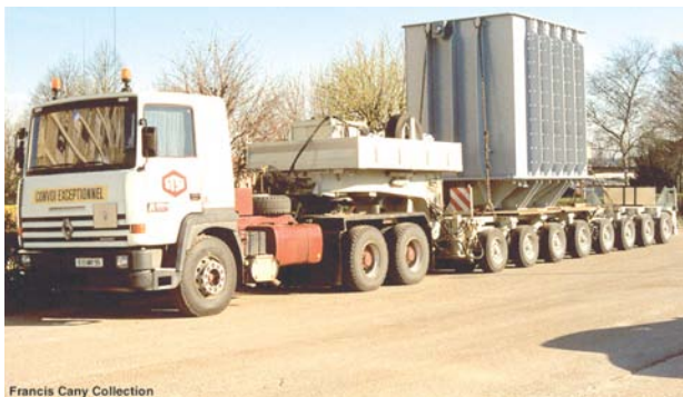
Francis Cany Collection

Depuis la mise en place de ce dispositif, la Chambre a suivi 120 entreprises des Yvelines et du Val d'Oise en leur proposant un programme d'accompagnement collectif leur permettant d'améliorer leurs performances en matière d'environnement et de développement durable. Parmi celles-ci, 17 ont atteint la certification ISO 14001, dont trois seulement dans le Val d'Oise (ITW à Taverny, Soufflerie Climatique Ile-de-France à Saint-Ouen l'Aumône et STSI à Gonesse). Ces entreprises lauréates fraîchement certifiées se sont retrouvées le 26 mars dernier à Versailles pour un déjeuner suivi d'une remise de trophée. L'occasion de vous présenter l'une d'entre elles.