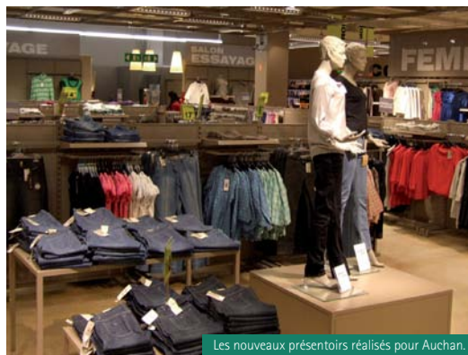
Les nouveaux présentoirs réalisés pour Auchan.

Leader européen dans la fabrication de mobiliers PLV et de mobiliers de magasins, Fapec a décroché de beaux marchés ces derniers mois. L'entreprise fabrique les nouveaux rayons habillage pour femmes du distributeur Auchan, en créant des présentoirs pour sa gamme In Extenso. Le concept a été déployé dans 120 hypermarchés. Cet espace est organisé sur le principe d'une boutique commerciale. Les résultats sont encourageants : à Vélizy, le plus important Auchan de France, les ventes ont augmenté de 8%. Par ailleurs, l'entreprise a été