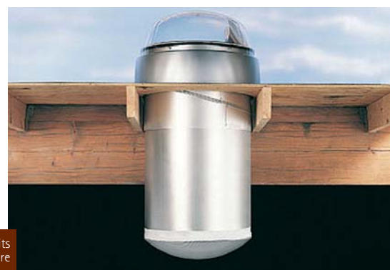
Puits de lumière

val d'oise le département Comité d'expansion économique