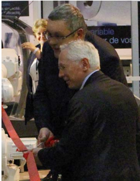
ABB France est filiale du groupe ABB, un des leaders mondiaux dans le domaine des technologies de l'énergie et de l'automatisation destinées à des secteurs variés tels que les services publics et les infrastruc-

tures, l'industrie et la construction de machines, les bâtiments résidentiels et non résidentiels, les centres de données et les réseaux électriques intelligents et le transport. Aujourd'hui, ABB est le n°1 mondial des moteurs ou drives, des génératrices pour les éoliennes, des transformateurs haute tension, des réseaux intelligents pour smart grids. Implanté industriellement en France depuis 1979, le groupe fabrique dans ses usines hexagonales (situées en régions Rhône-Alpes, Midi Pyrénées et Alsace) des produits basse tension destinés au monde entier. En France, ABB regroupe 2000 personnes réparties sur une vingtaine de sites. Après des années sombres et des plans de licenciement conséquents, qui avaient notamment concerné son les divisions Robotique Produits d'Automatisation installées à Saint-Ouen l'Aumône, la multinationale suisse a changé de cap pour s'orienter vers des marchés finaux à forte croissance et a annoncé en 2013 un plan de recrutement d'environ 140 postes dont 80 apprentis. http://new.abb.com/fr