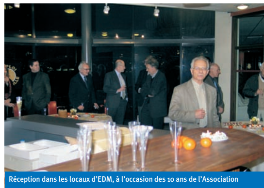
Réception dans les locaux d'EDM, à l'occasion des 10 ans de l'Association