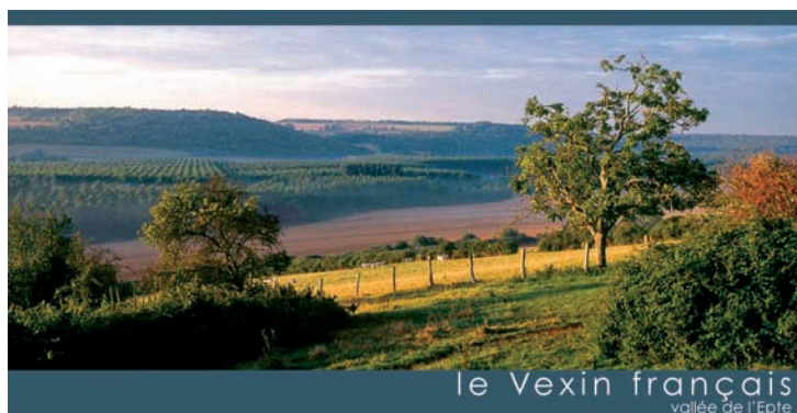
le Vexin français vallée de l'Epte

de lumière l'environnement de la région du Vexin. En passant par les villages d'Auvers-sur-Oise, de Bellay en Vexin, de Wy-dit-Joli-village, par le donjon de la Roche-Guyon, de l'Eglise de Nucourt, les cartes postales proposent un diaporama des plus beaux paysages naturels, architecturaux, de la faune et de la flore de notre région. En vente au musée de Théméricourt ou par Internet sur www.alizari.fr , pour 1,80 euro la carte et 16 euros le coffret.