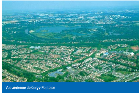
Vue aérienne de Cergy-Pontoise