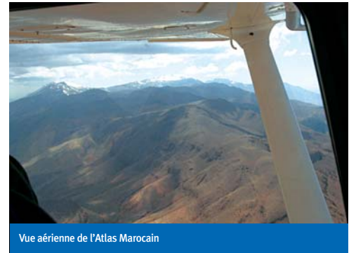
Vue aérienne de l'Atlas Marocain