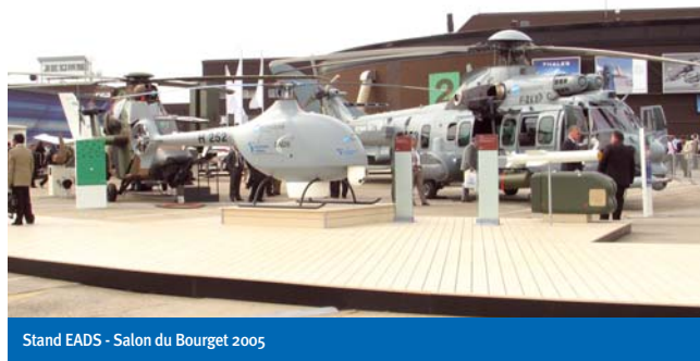
Stand EADS - Salon du Bourget 2005

Cette entreprise est spécialisée dans le traitement et revêtement des métaux : 40 % de son marché provient de l'aéronautique. MICROFRAL applique des micro-particules de lubrifiants solides dans le matériau qui y restent à jamais incrustés. Les produits traités sont compatibles avec tous combustibles, résistant à l'usure, à la pression, à la température (-250°C à +1100°C) ainsi qu'aux radiations. Jacques Gautier , PDG, a repris cette entreprise en 1999 qui à l'origine était un process