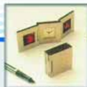
Pendulettes objets de bureau