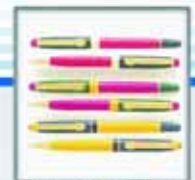
Stylos-bille, plume roller, mine, surligneur