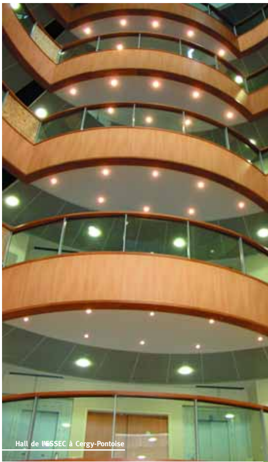
Hall de l'ESSEC à Cergy-Pontoise

(terra π), à prononcer "thérapie" est une marque de produits brésiliens de bien-être à la croisée de l'aromathérapie et de la phytothérapie. Issus des traditions brésiliennes ancestrales, ils contribuent à l'harmonie du corps et de l'esprit. (terra π) travaille en étroite collaboration avec des artisans, associations et producteurs du Brésil. Le projet vise à leur favoriser un développement durable, ainsi que préserver l'usage et la connaissance des plantes médicinales et de promouvoir la médecine traditionnelle en Europe.