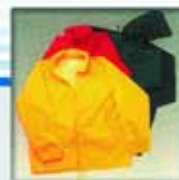
Coupe-vent. Tout le textile